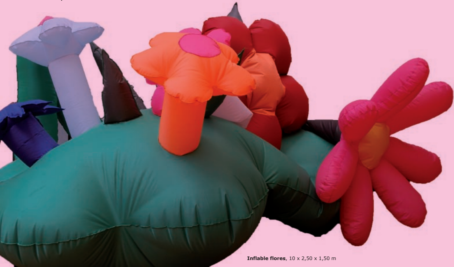
Inflable flores, 10 x 2,50 x 1,50 m